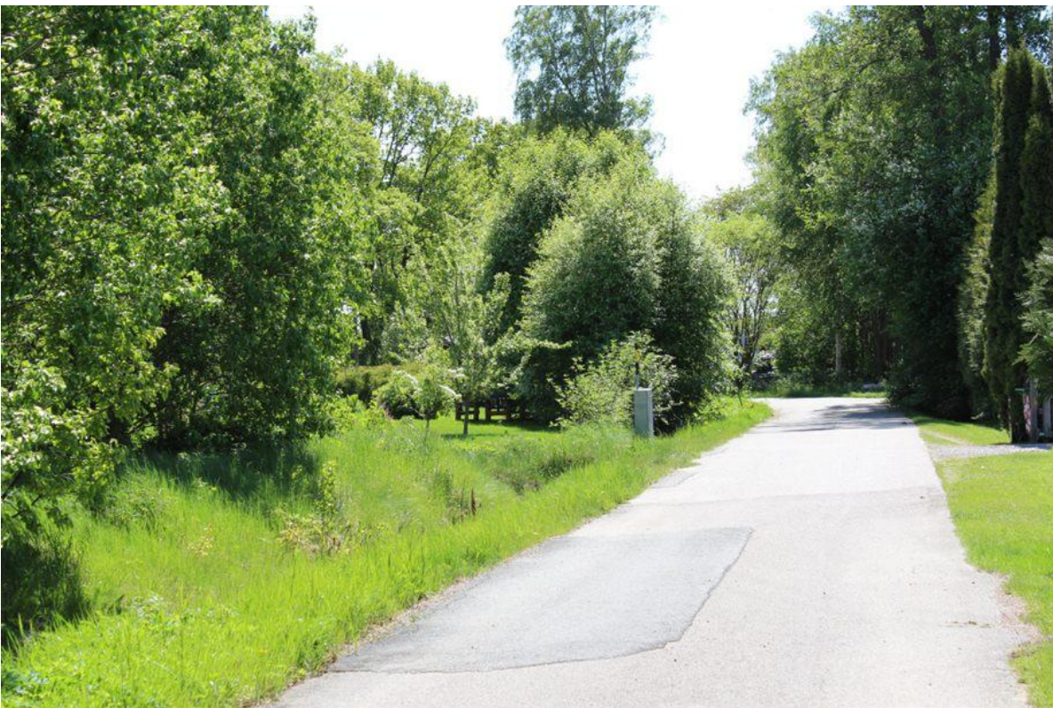
Tomten till vänster om vägen är numera...